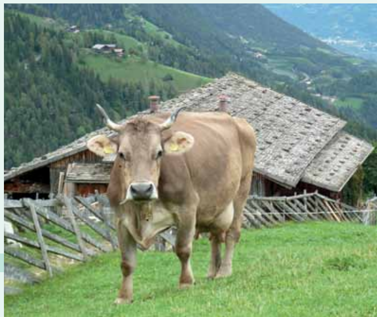
Foto scattata presso l'azienda Peter Laimer, San Pancrazio Val d'Ultimo (Bolzano).

Sono quasi 1.500 i capi iscritti al Registro anagrafico Bruna linea carne "OB" che risultano tuttora viventi. Le aree a maggiore diffusione sono riportate nel grafico 1 della pagina che segue. Bolzano e Bergamo, con circa il 70% dei capi totali, sono le province con le presenze più corpose. Appartengono al "Registro principale", quello con i soggetti con almeno due